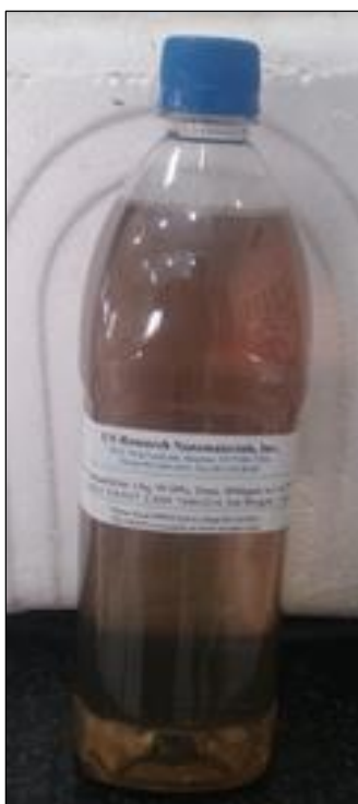
شکل ۱: نمونه نانو ذرات کلئید استفاده شده در تحقیق.

از نانو ذرات نقره کلئید تولیدی US Research Nanomaterials, Inc. کشور آمریکا استفاده گردید. این محصول حاوی نانو ذرات نقره با خلوص ۹۹/۹۹ درصد با اندازه متوسط ۲۰ نانومتر و غلظت ۴۰۰۰ میلی‌گرم در لیتر می‌باشد. محصول به شکل مایع و با رنگ متمایل به قهوه‌ای و در بسته‌بندی یک لیتری تهیه گردید.